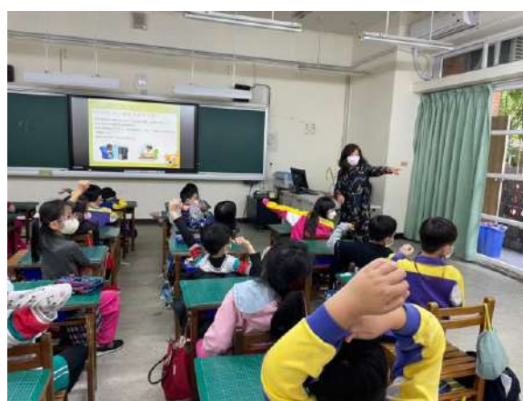
說明：視力保健行動研究教學活動