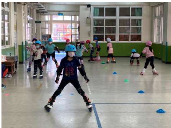
說明：戶外活動社團-週末育樂營/直排輪