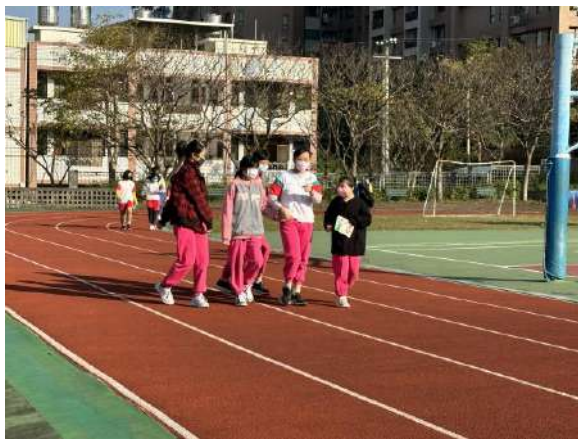
說明：下課走出教室活動(打球、跑步…等多元活動)