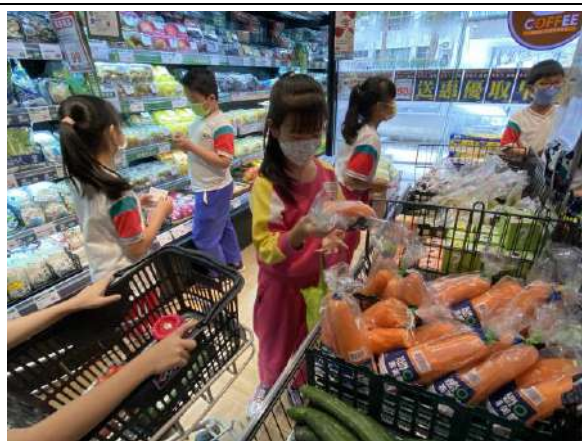
說明：走出教室-配合營養教育規劃大賣場採買體驗活動。