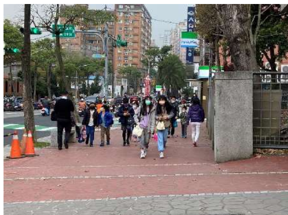
說明：鼓勵學生走路上放學，增加戶外活動時間。