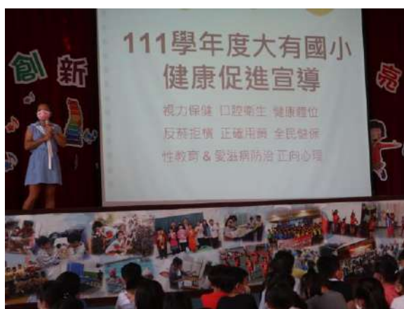
說明：視力保健始業式宣導