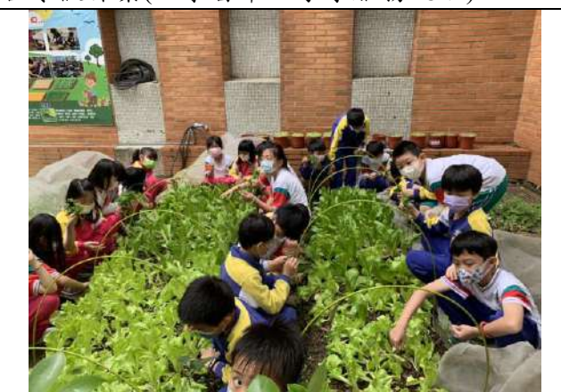
說明：食農教育-種菜、除草體驗。