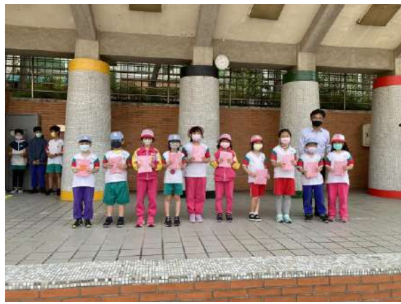
說明：校園解謎闖關活動抽獎，獎勵參與學生