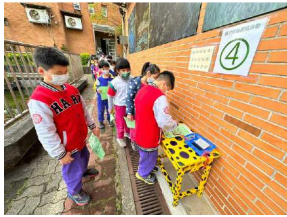
說明：校園解謎闖關活動-增加學生下課走出教室的動機