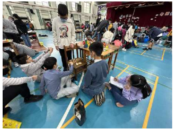
說明：大有機關王-一起來動腦。