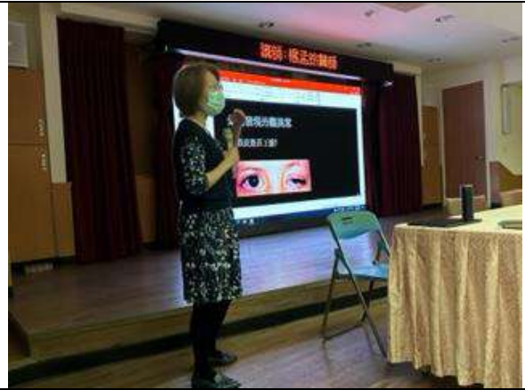
說明：視力保健向下紮根-幼兒園教師視力保健增能研習。