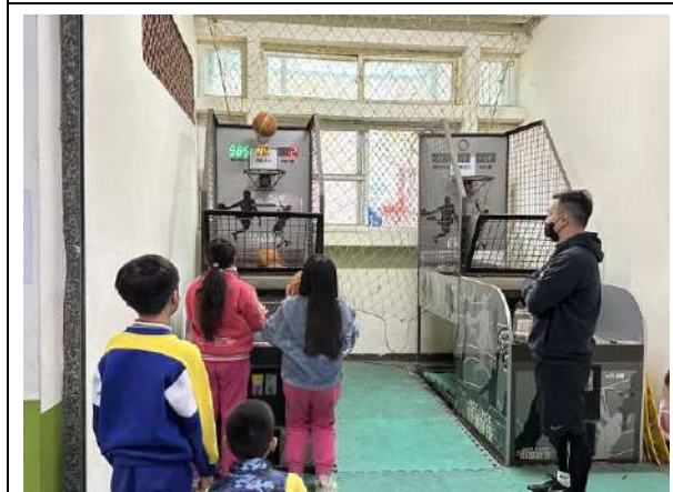
說明：投籃機設置增加讓學生下課走出教室活動的誘因，提供學生多元活動選擇。