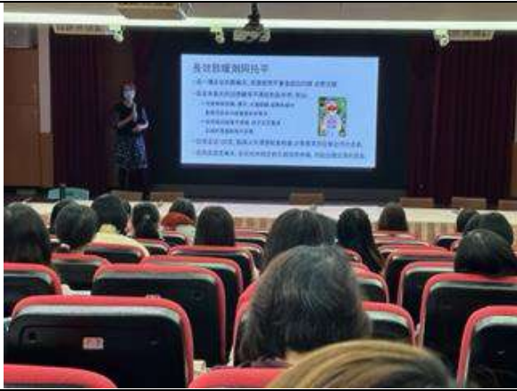
說明：幼兒園視力保健師資增能研習-視力保健從小做起。