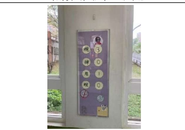
說明：視力保健標語競賽。