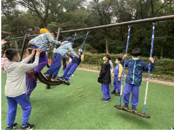
說明：走出戶外-大有梯田公園體能趣。