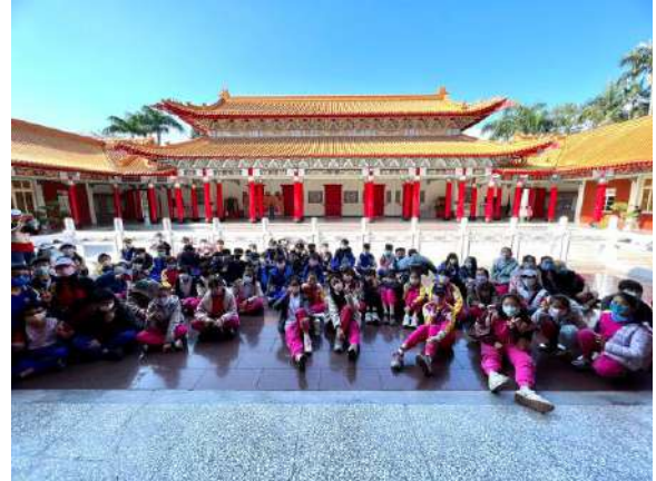
說明：走出戶外-桃園孔廟參訪。