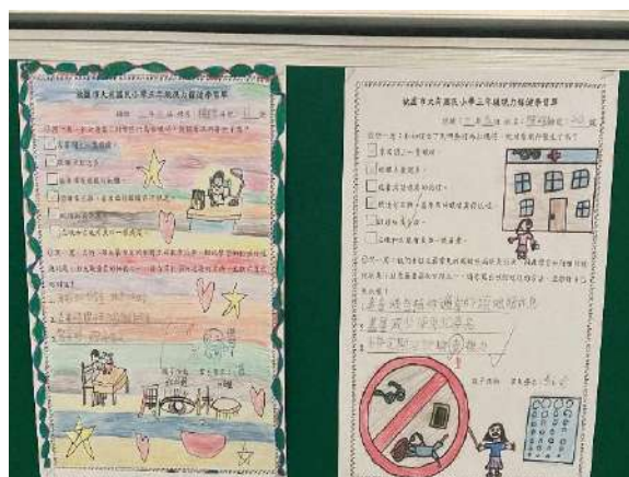
說明：視力保健學習單