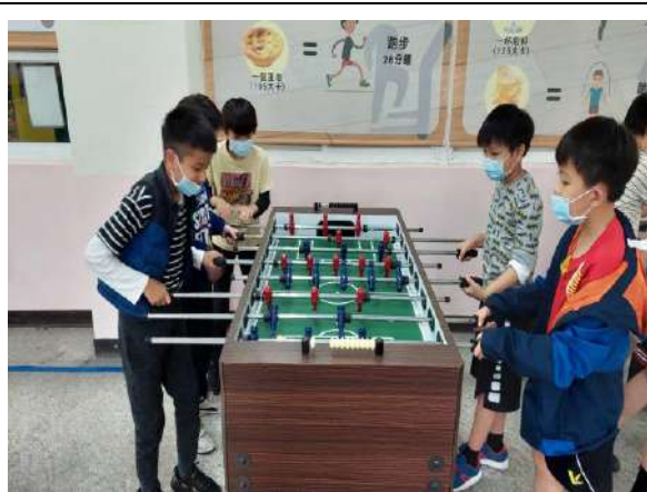
說明：樂活運動站-購置多款休閒娛樂設備，提供學生進行多元活動。