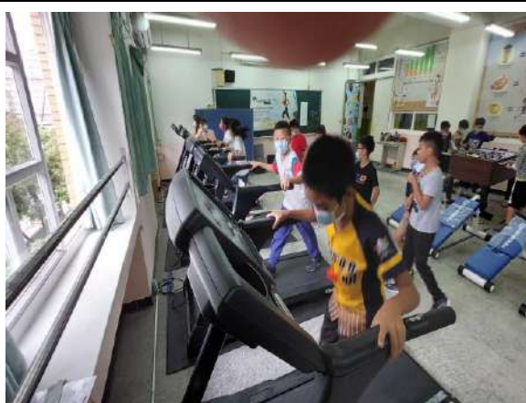
說明：樂活動運動站-多元活動空間鼓勵學生中斷用眼。