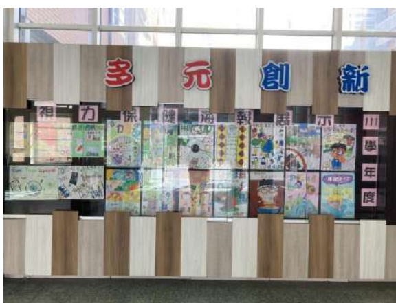
說明：寒假作業-視力保健海報展覽。