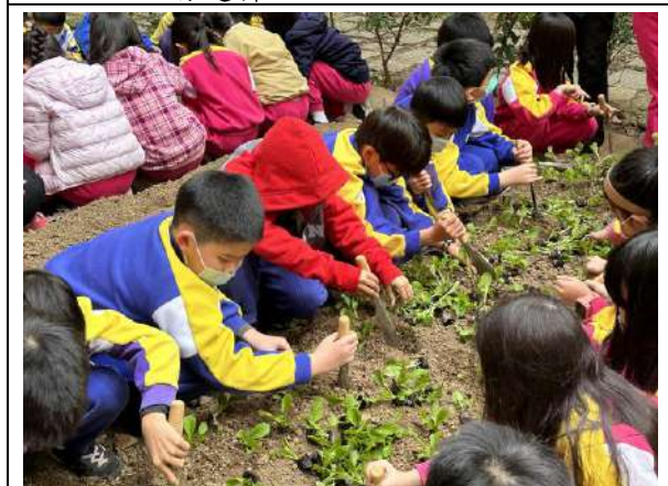
說明：配合自然課程的食農種菜體驗增加學生走出教室的機會。