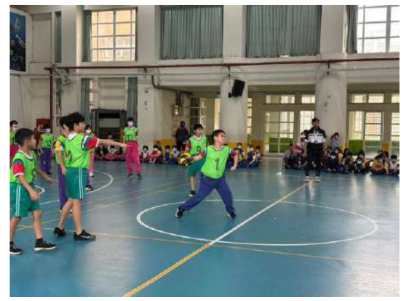
說明：學年體育競賽-躲避球賽。