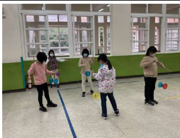
說明：多元社團學習，激發學生運動興趣，提昇學生下課活動動機。