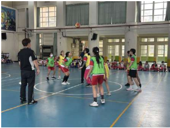
說明：學年體育競賽-會長盃籃球賽。