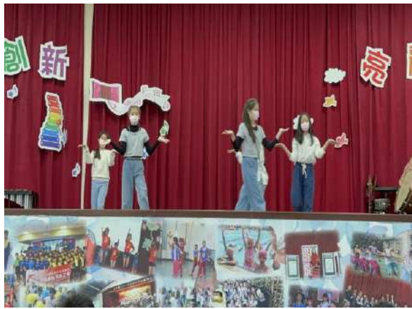
說明：大有之星才藝發表會。