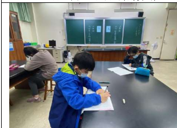
說明：視力保健議題融入語文競賽中。