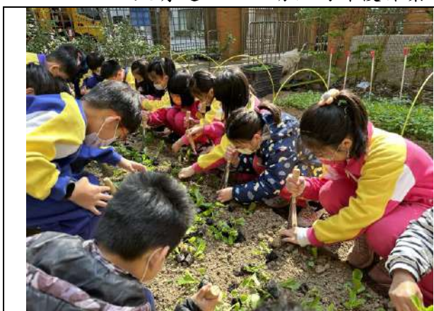
說明：自然課程結合校園食農教育。