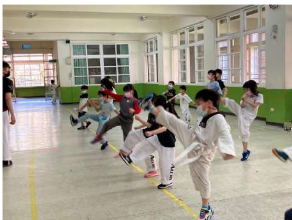
說明：戶外活動社團-週末育樂營/跆拳道