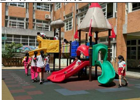
說明：下課走出教室活動-遊戲區活動