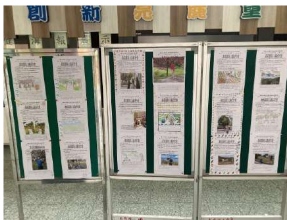
說明：寒假作業-視力保健學習單展示。