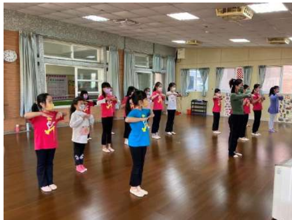
說明：戶外活動社團-週末育樂營/舞蹈營