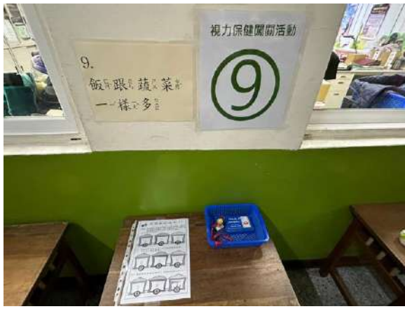
說明：校園解謎闖關關卡設置